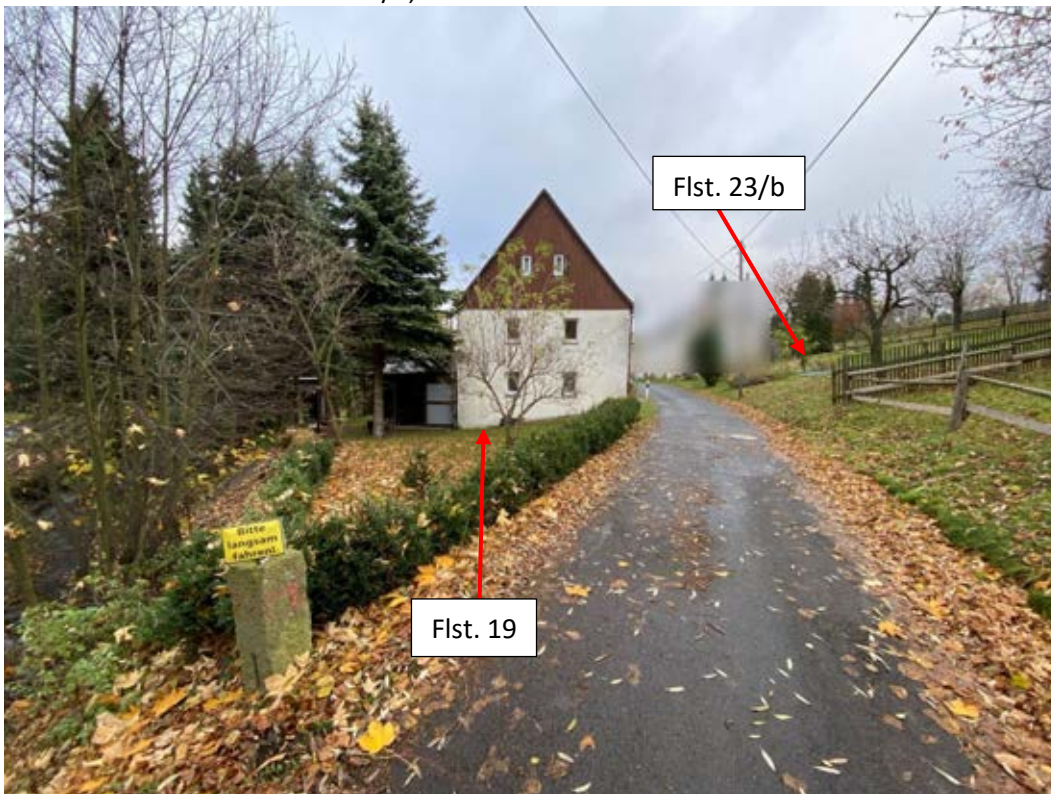
Blick entlang der Oelsener Straße aus südlicher Richtung