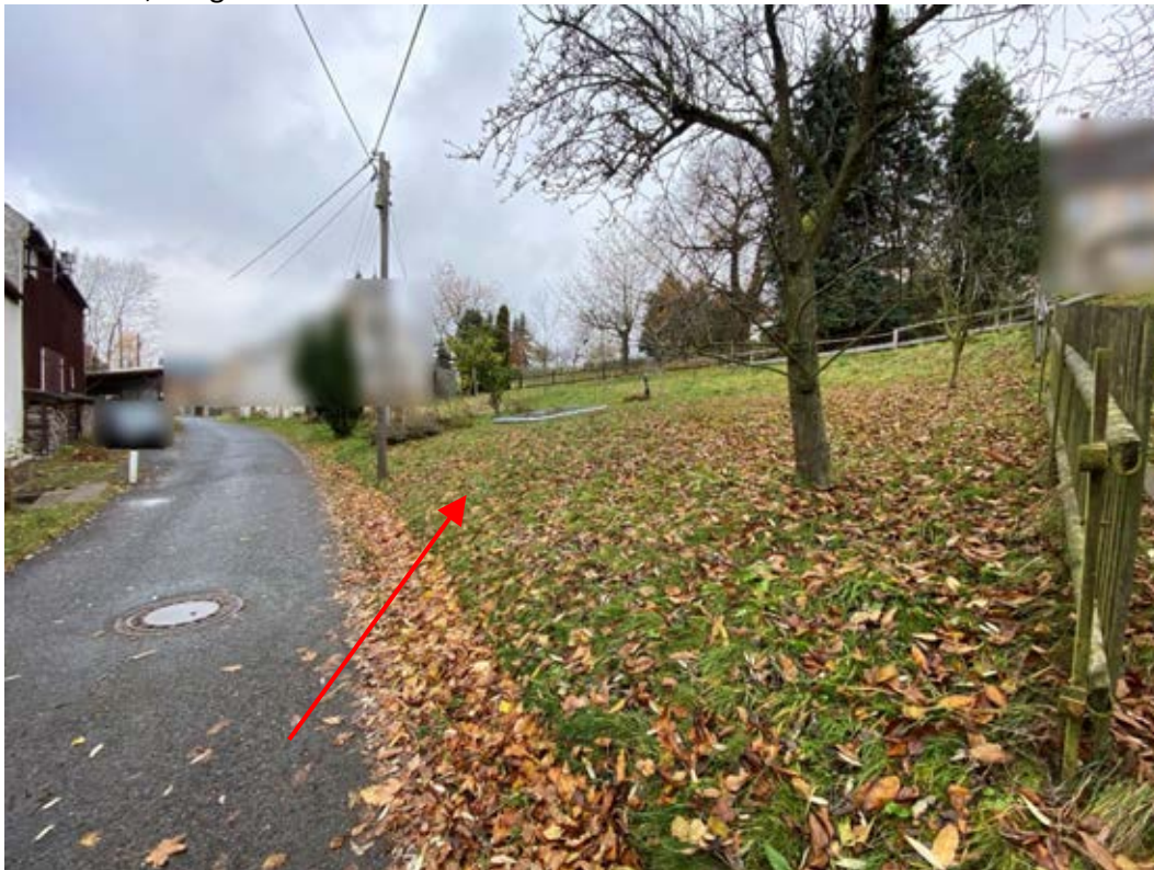
unbebautes Grundstück Flst. 23/b gegenüber