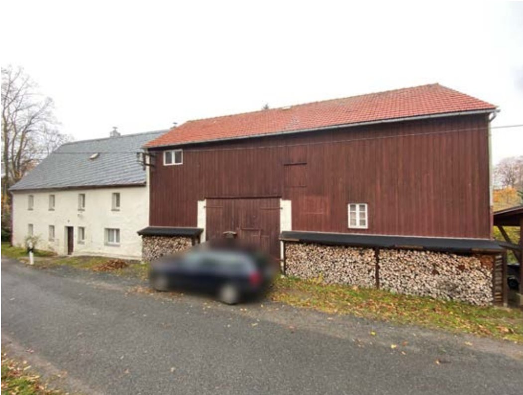
Blick von der Oelsener Straße aus östlicher Richtung; links: Wohnhaus, rechts: Scheune