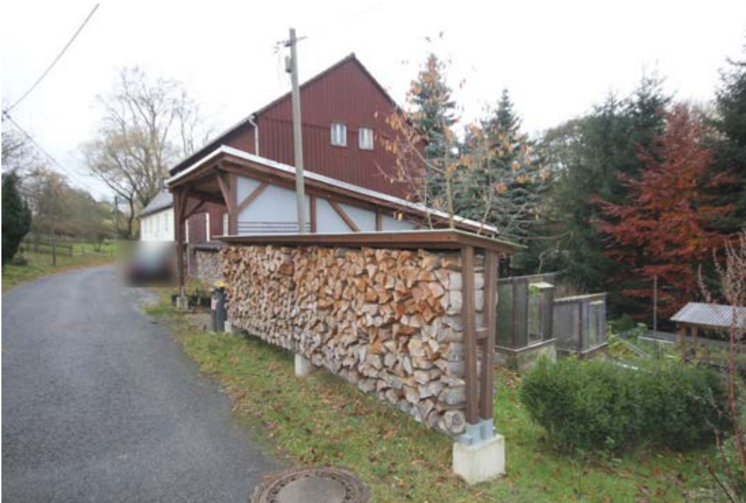
Holzlager und dahinter der Carport sowie der Nordgiebel der Scheune