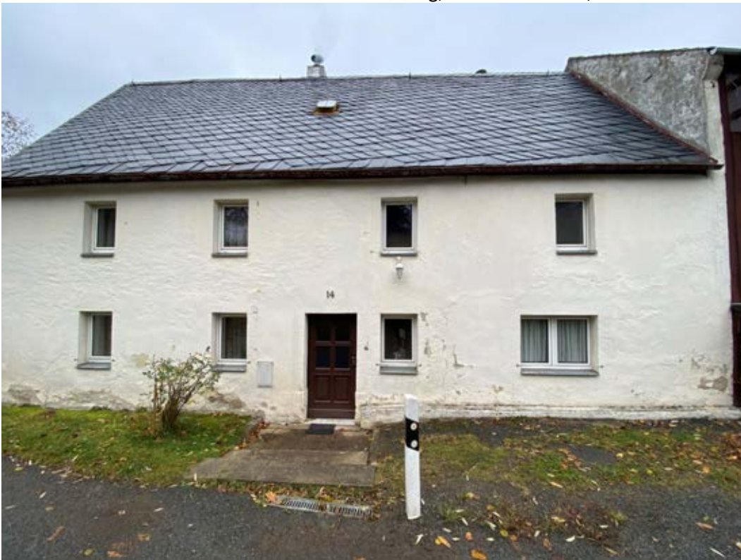
Wohnhaus, östliche Längsseite