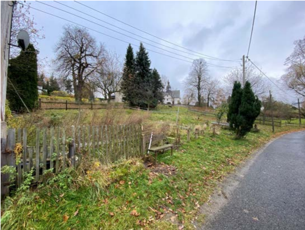
unbebautes Grundstück Flst. 23/b; Blick von der Oelsener Straße