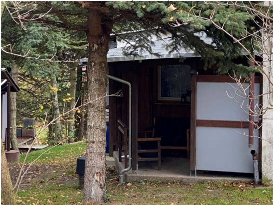
Überdachung hinter dem Wohnhaus