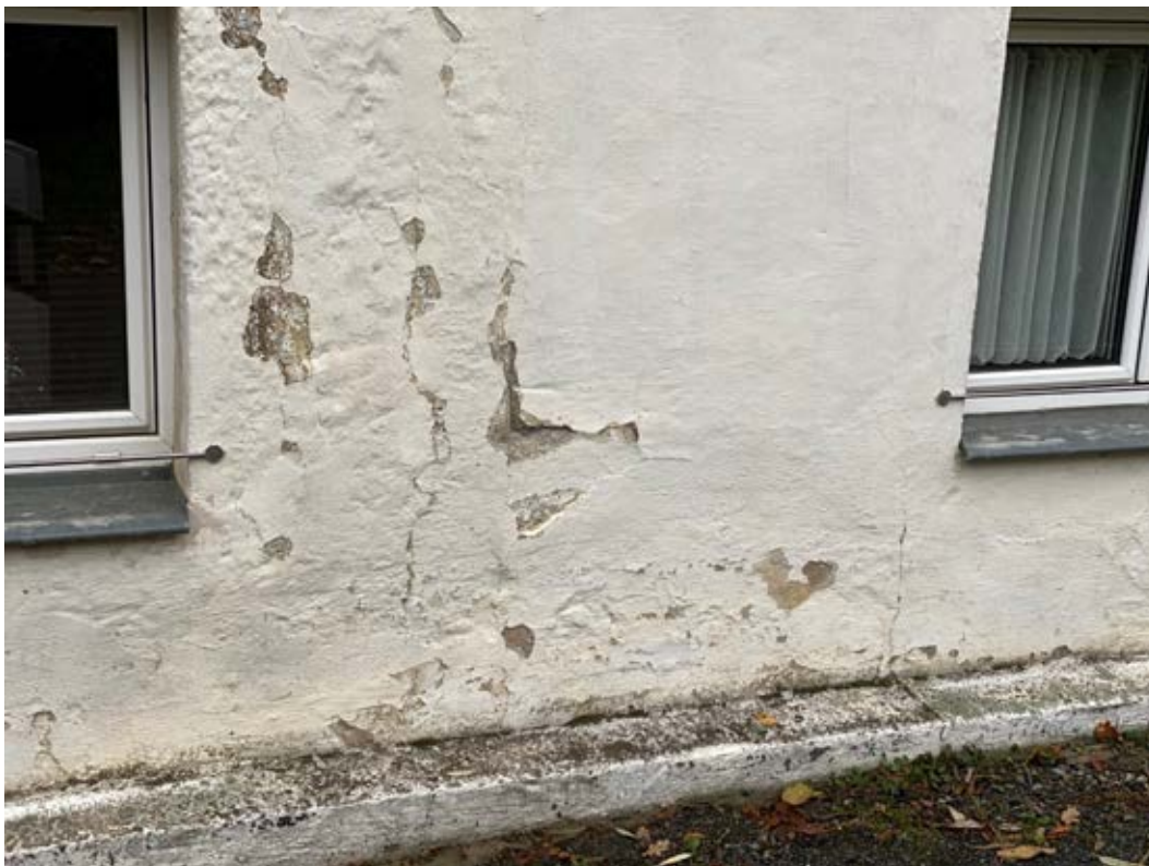
Schäden an der Fassade des Wohnhauses (Straßenseite)