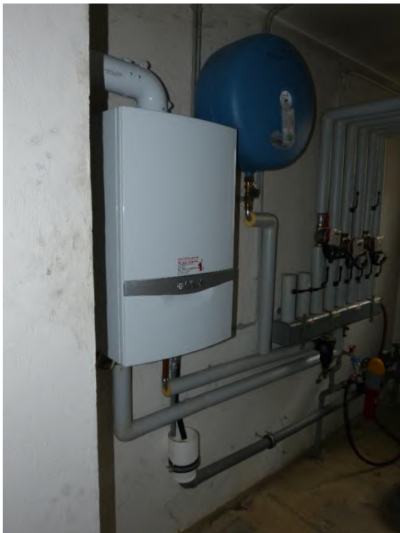
Mehrfamilienhaus, Innenaufnahme Heizungsraum