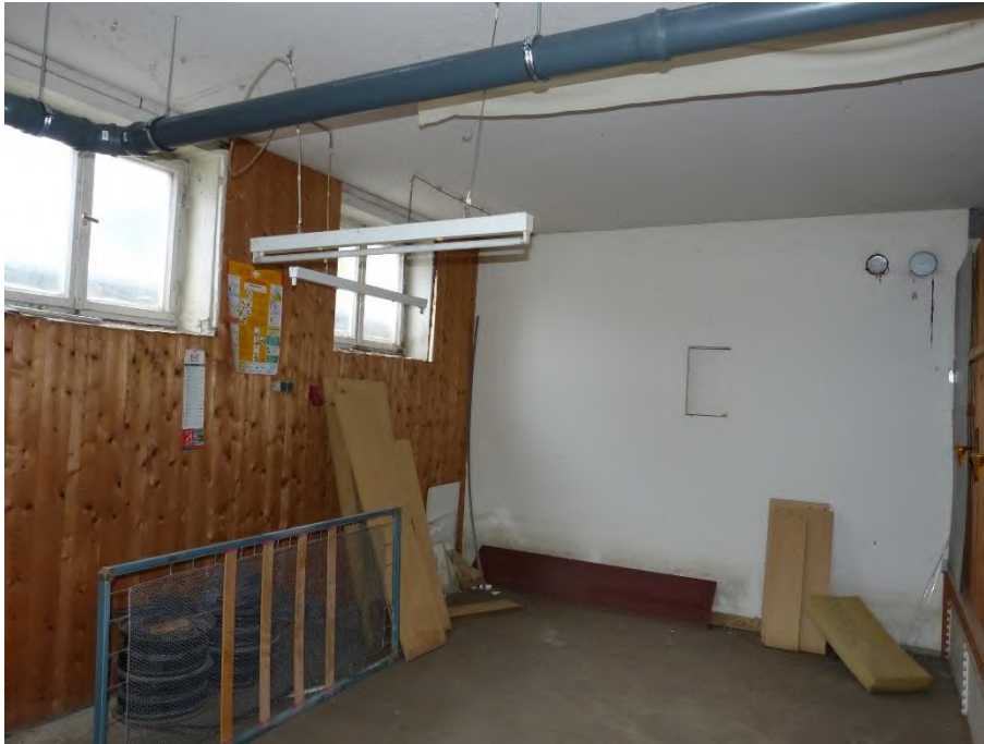
Mehrfamilienhaus, Innenaufnahme Kellerraum zu Wohnung Nr. 3