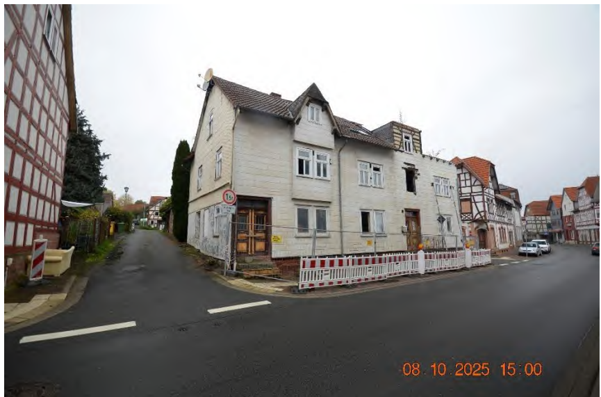
Ansicht von Südosten