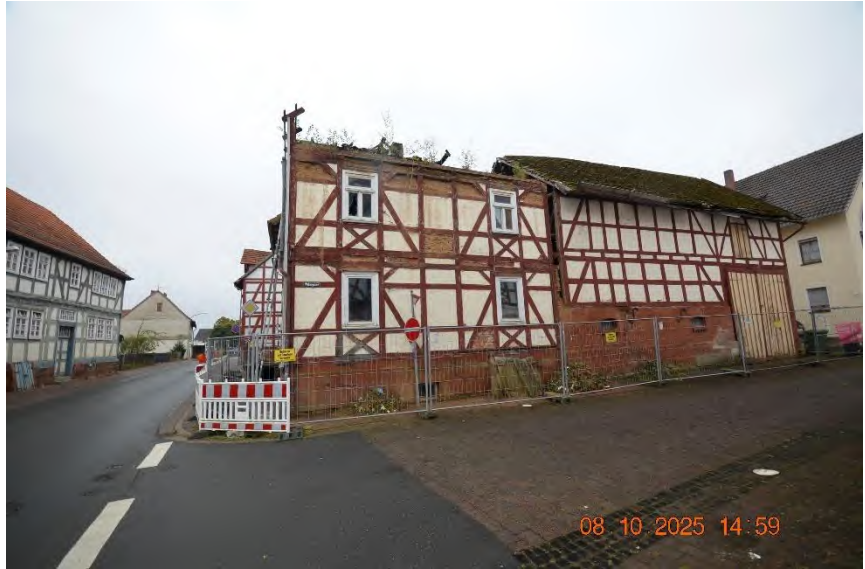
Ansicht von Norden