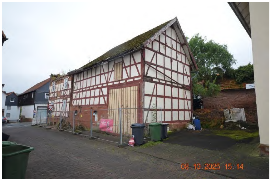
Ansicht von Nordwesten