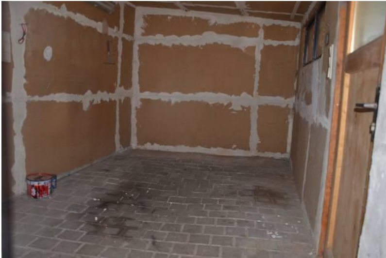
Foto 19 INNENRAUM DES NEBENGEBÄUDES