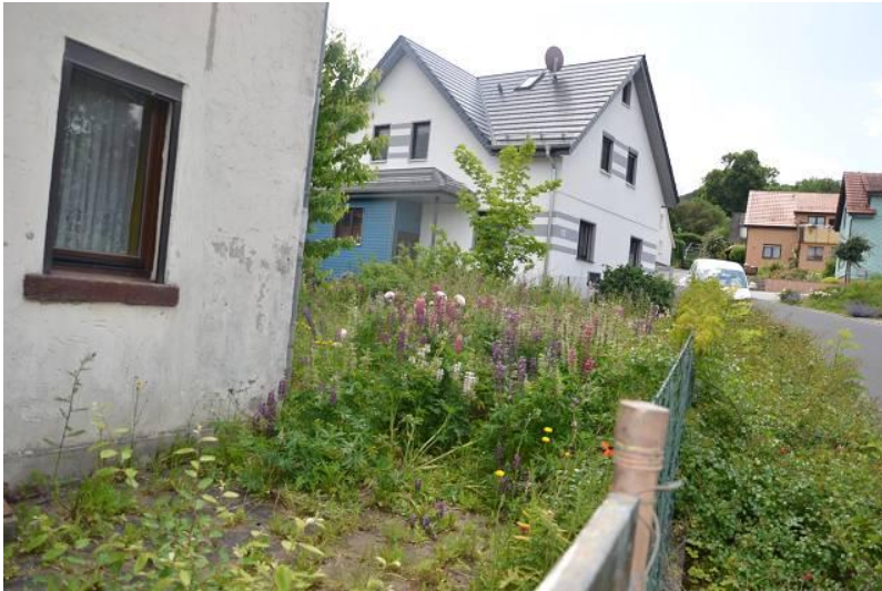
Foto 22 VERWILDERTER GARTEN