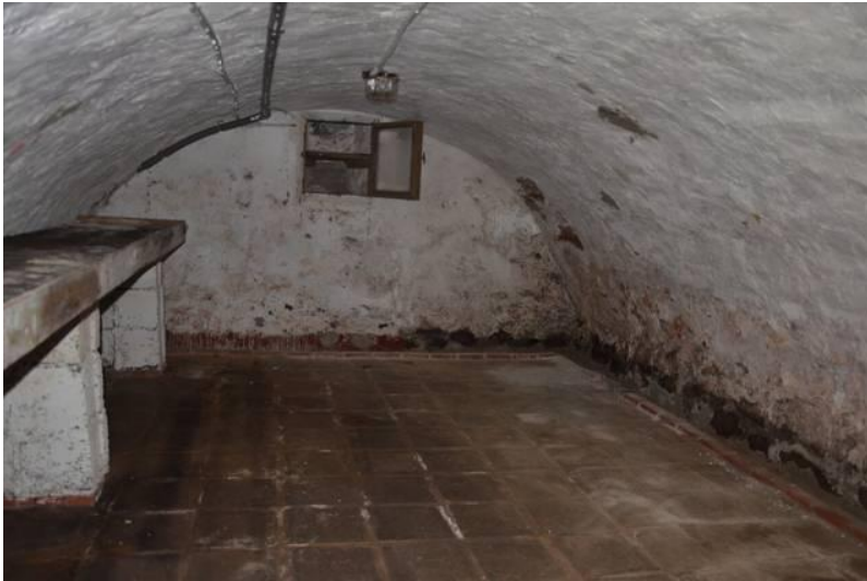
Foto 16 KELLERRAUM