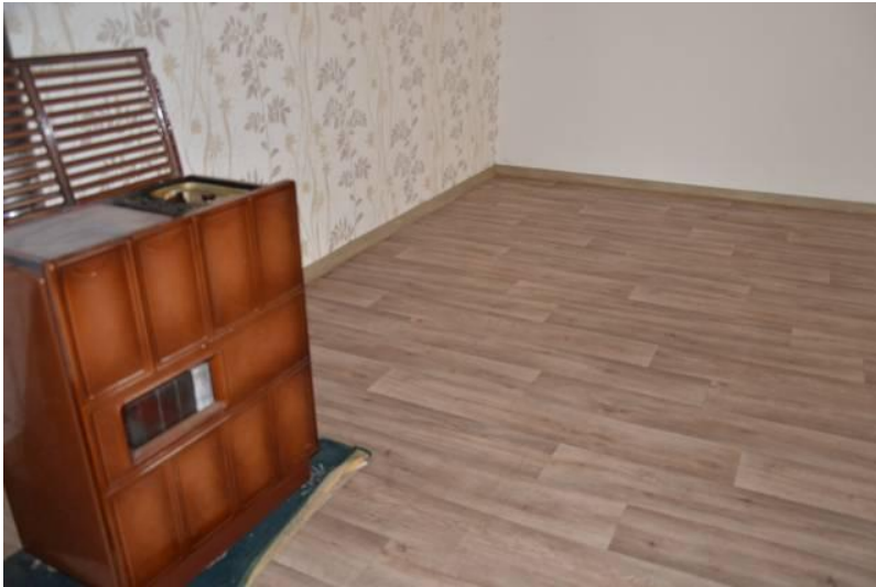
Foto 13 RAUM IM ERDGESCHOSS