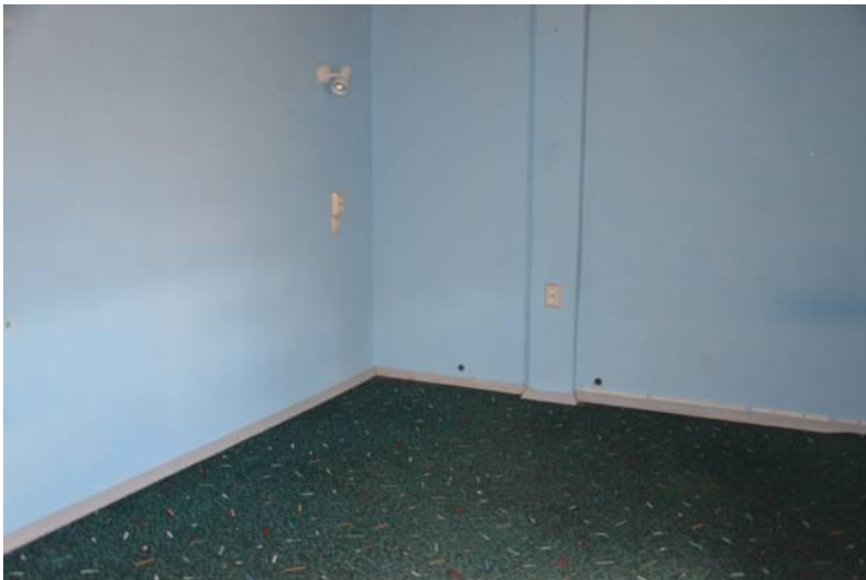
Foto 8 RAUM IM OBERGESCHOSS