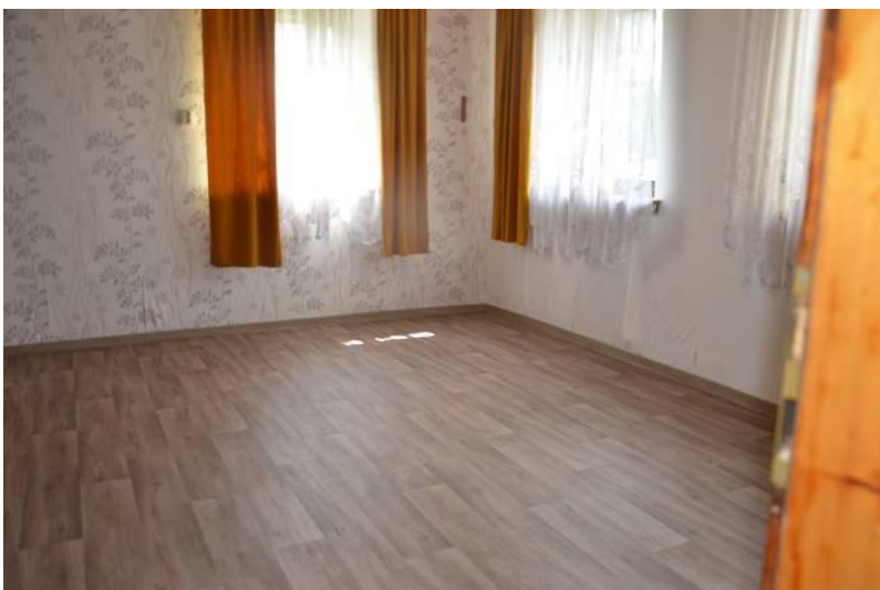
Foto 12 ZIMMER IM ERDGESCHOSS