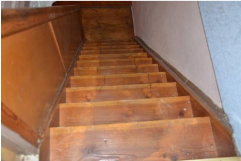
Foto 10 TREPPENRAUM