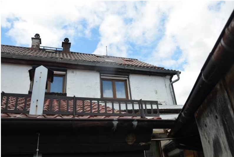
Foto 4 ANSICHT VOM HINTERRAUM