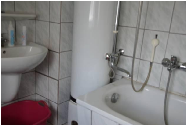
Foto 9 BADEZIMMER IM OBERGESCHOSS