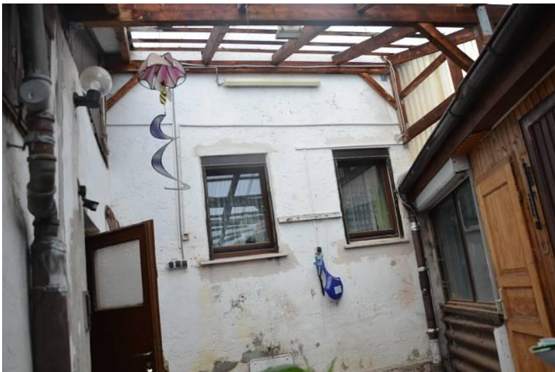
Foto 17 HOFÜBERDACHUNG UND NEBENGEBÄUDE