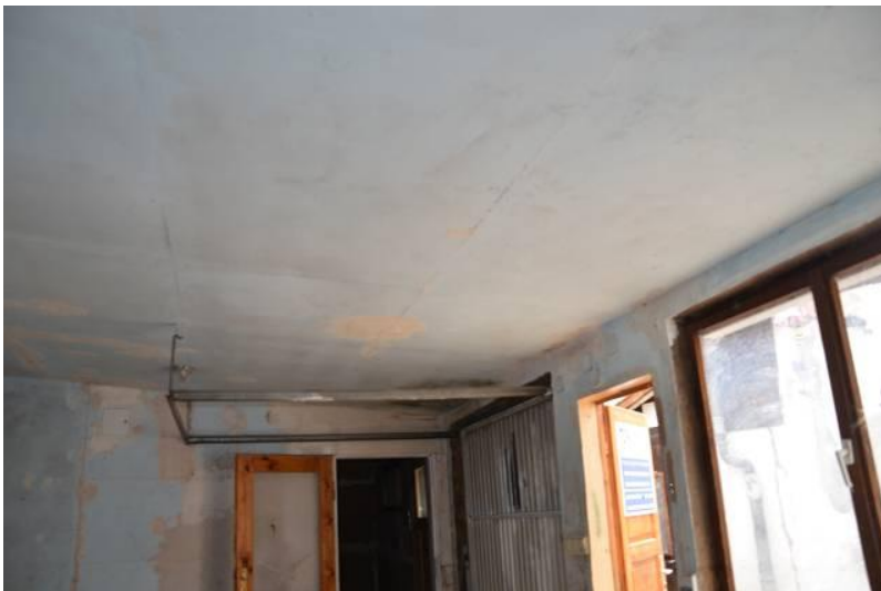
Foto 20 INNENRAUM DES NEBENGEBÄUDES