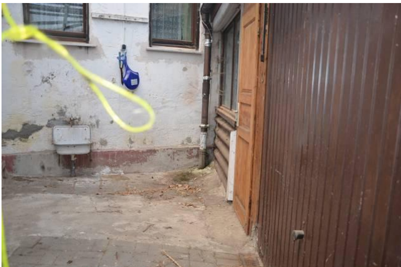
Foto 21 HOF MIT NEBENGEBÄUDE