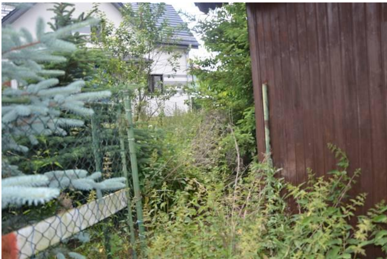
Foto 23 HINTERRAUMBereich