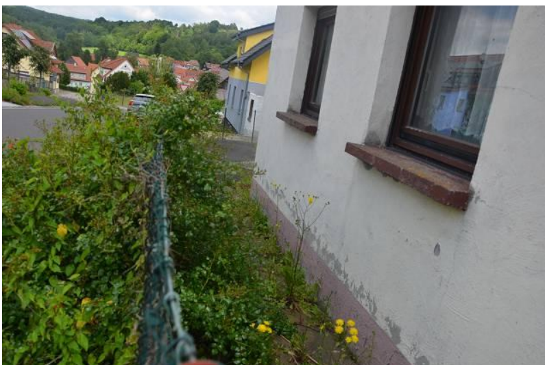
Foto 24 FLURSTÜCK 133/ 34 UNBEBAUTES GRUNDSTÜCK, BEWACHSENER STREIFEN ENTLANG DES ZAUNES