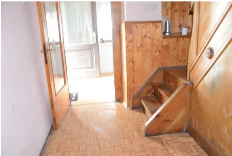
Foto 14 EINGANGSBEREICH