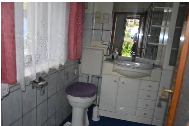
Foto 15 BAD IM ERDGESCHOSS