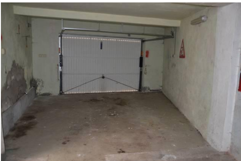
Foto 18 GARAGENINNENRAUM