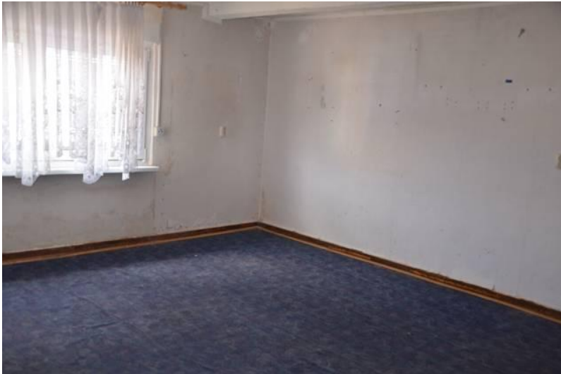
Foto 7 RAUM IM OBERGESCHOSS