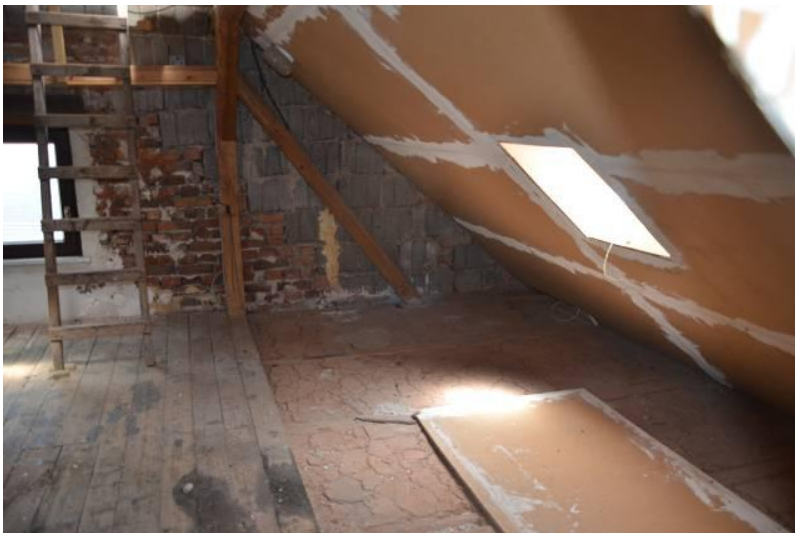
Foto 5 DACHRAUM