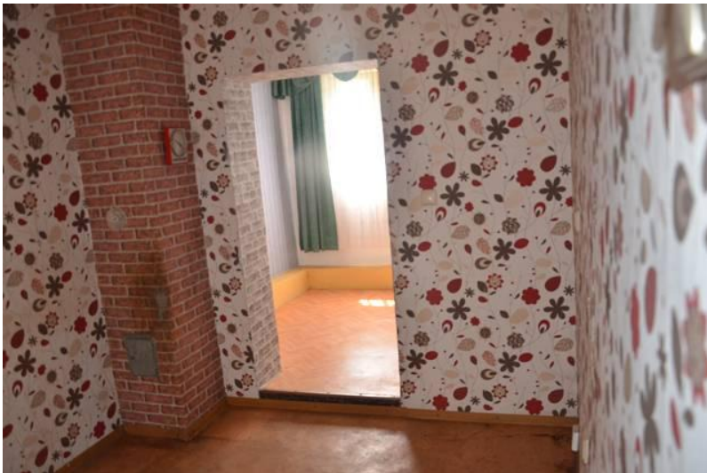
Foto 11 RAUM IM ERDGESCHOSS