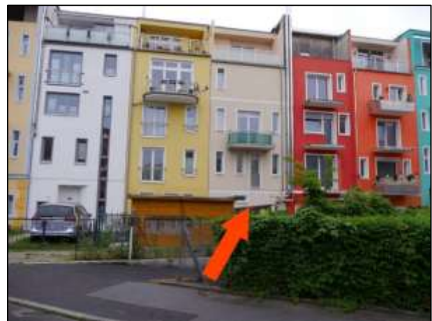
Gebäudefront zum Königsweg