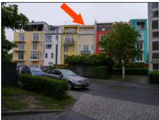
Gebäudefront zum Königsweg