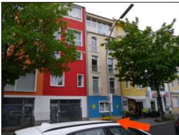
Gebäudefront zur Buddestraße