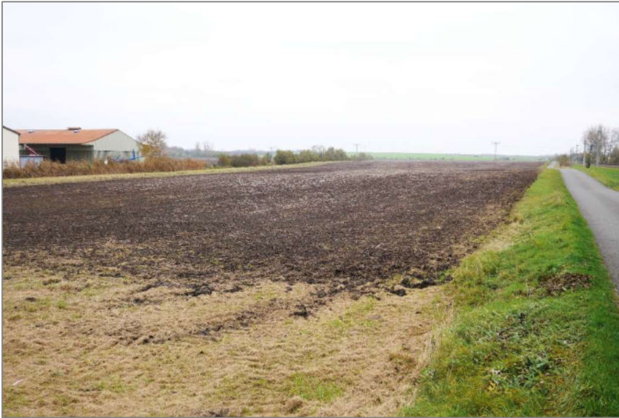
Foto 1 - Flurstück 101/1 in der Flur 13 - Ackerland