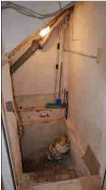
Bild 13: Keller Hinterhaus (vermutlich älter als das Hinterhaus) wird in der Teilungserklärung nicht erwähnt