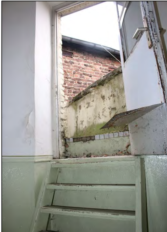
Foto Nr. 57: Gemeinschaftstreppenhaus, Treppenpodest, Ausgang Balkon