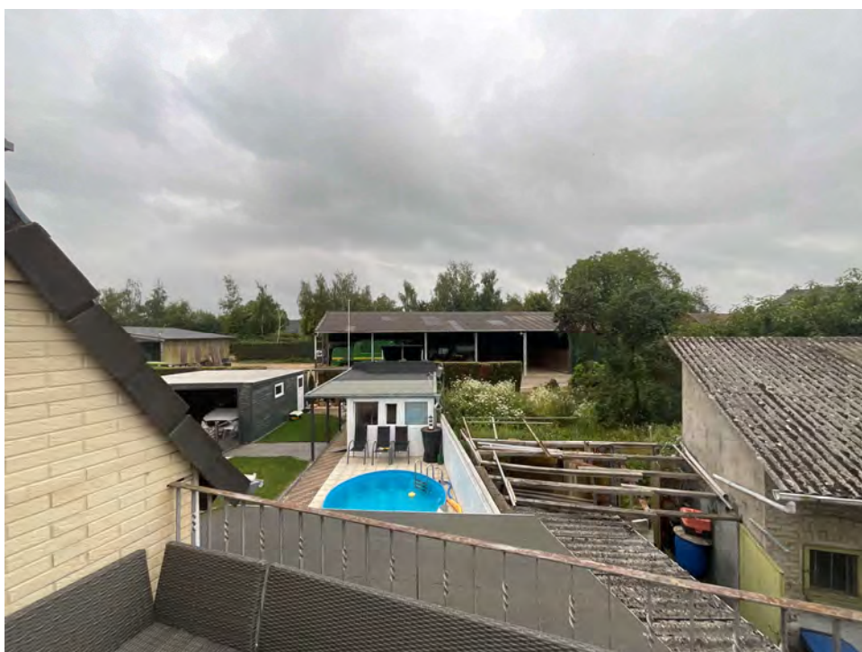
Lichtbild 10: Außenbereichsorientierung von der Terrasse der Dachgeschosswohnung