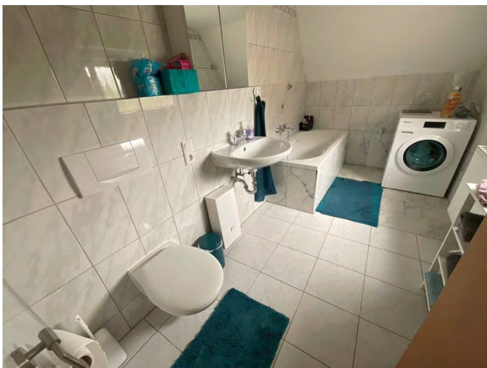
Lichtbild 8: Detail, sanitäre Einrichtungen Bad/WC der Dachgeschosswohnung