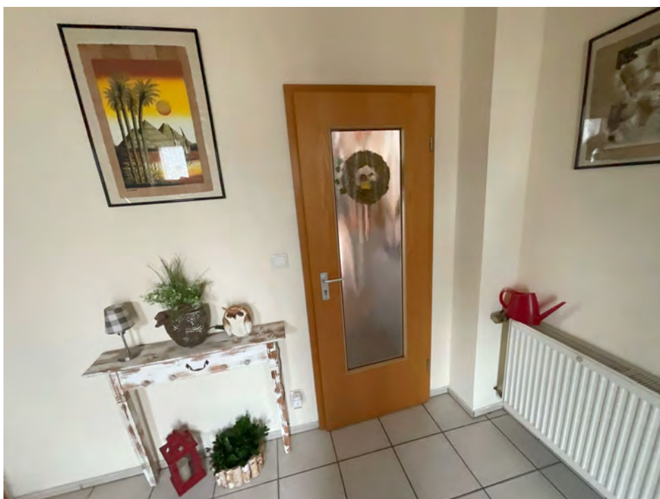
Lichtbild 4: Detail, Wohnungseingangstüre Erdgeschoss