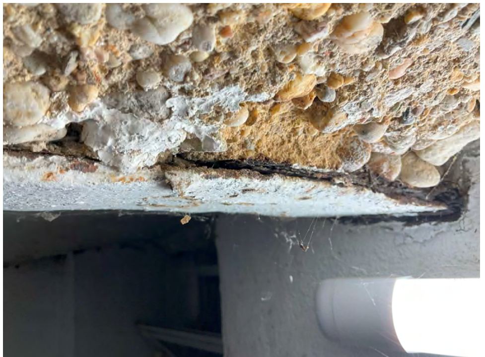
Lichtbild 12: Detail, Korrosionsschäden in den Auflagern im Kellergeschoss