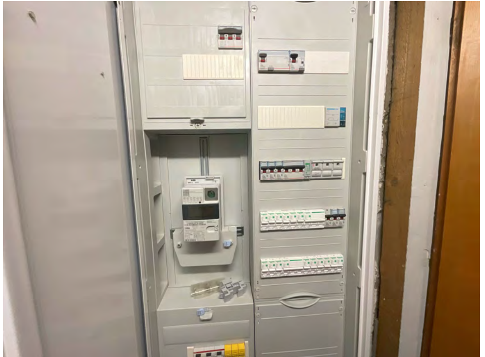
Lichtbild 11: Detail, Unterverteilung mit Sicherungsautomaten

Ortstermin am 24.07.2024 Kolpingstraße 32 in 50181 Bedburg (Blerichen)