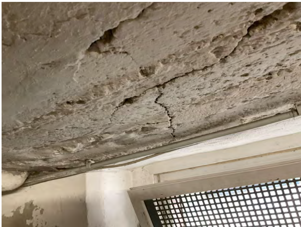
Lichtbild 13: Detail, Rissbildungen und stellenweise Zerstörungen des Betongefüges an der Kappendecke im Kellergeschoss

Ortstermin am 24.07.2024 Kolpingstraße 32 in 50181 Bedburg (Blerichen)