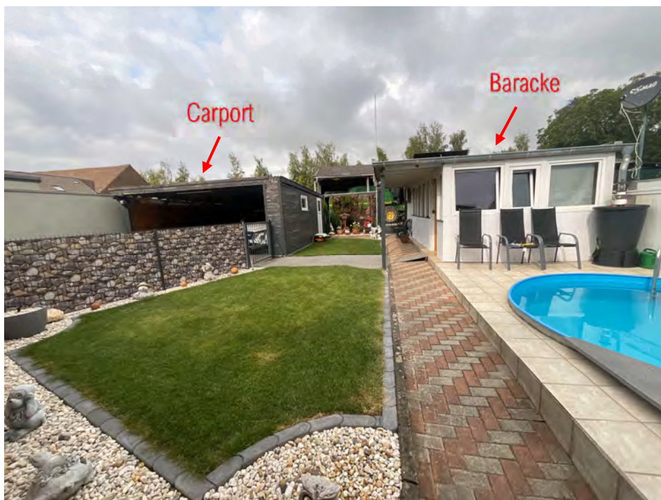
Lichtbild 9: Außenbereichsorientierung von der Terrasse der Erdgeschosswohnung

Ortstermin am 24.07.2024 Kolpingstraße 32 in 50181 Bedburg (Blerichen)