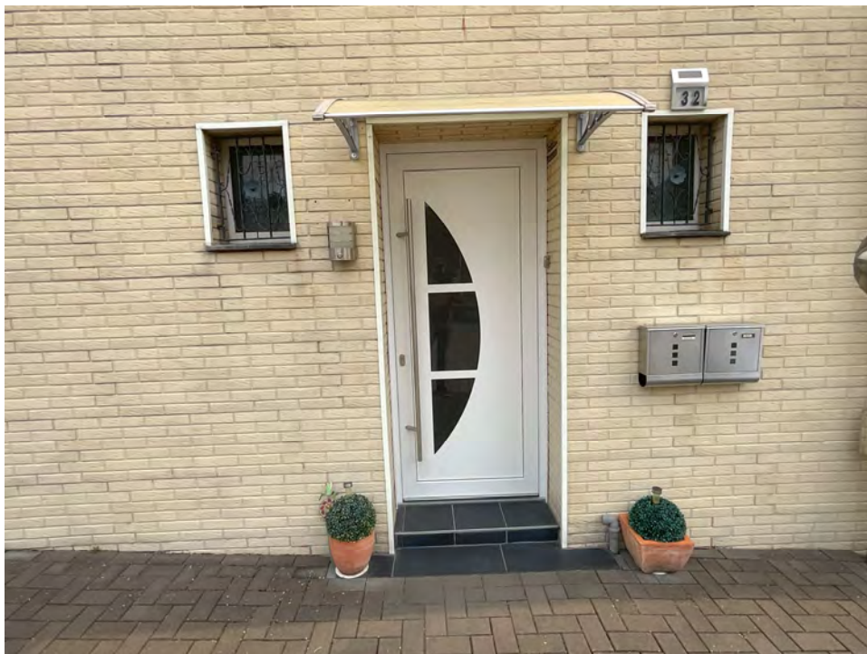
Lichtbild 3: Detail, Hauseingangstür „Kolpingstraße 32“

Ortstermin am 24.07.2024 Kolpingstraße 32 in 50181 Bedburg (Blerichen)