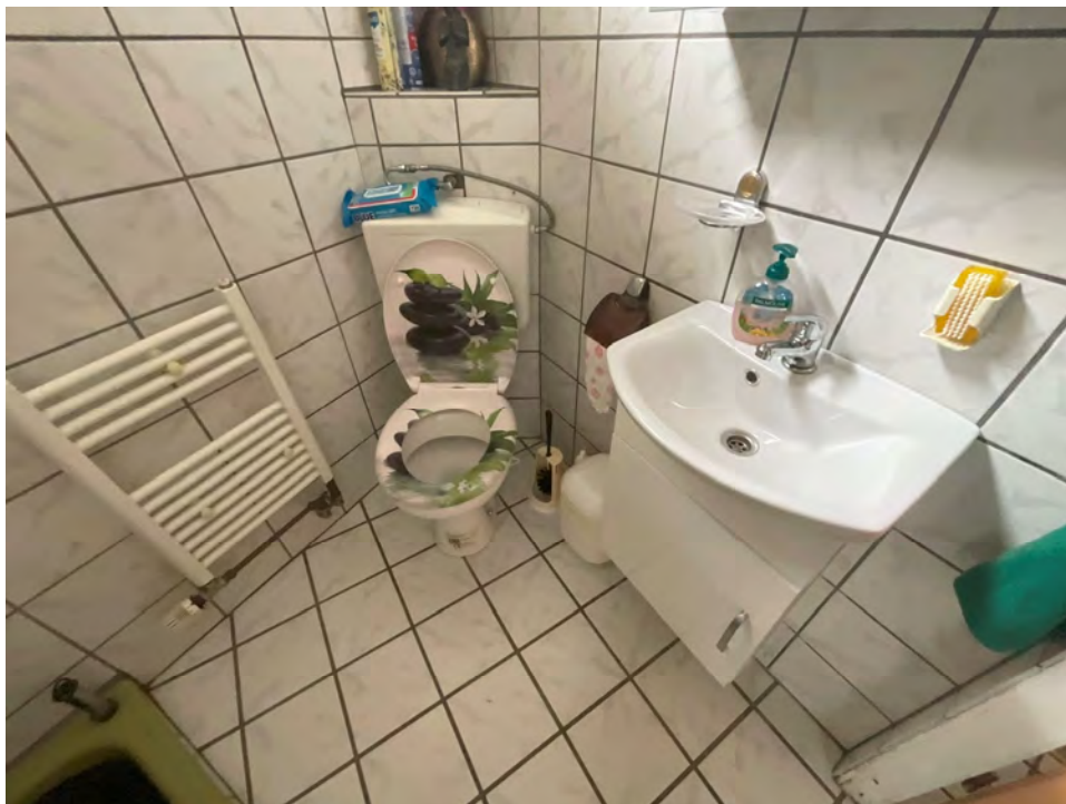
Lichtbild 7: Detail, sanitäre Einrichtungen Duschbad/WC in der Erdgeschosswohnung

Ortstermin am 24.07.2024 Kolpingstraße 32 in 50181 Bedburg (Blerichen)