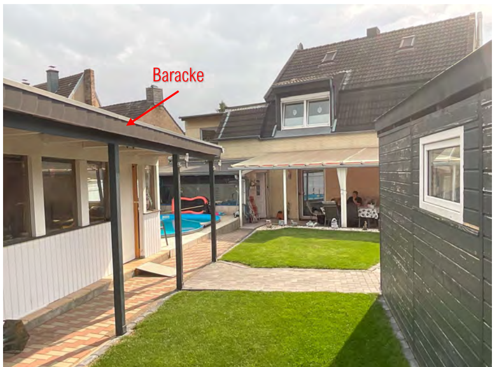
Lichtbild 2: Blick vom Garten auf das Haus „Kolpingstraße 32“