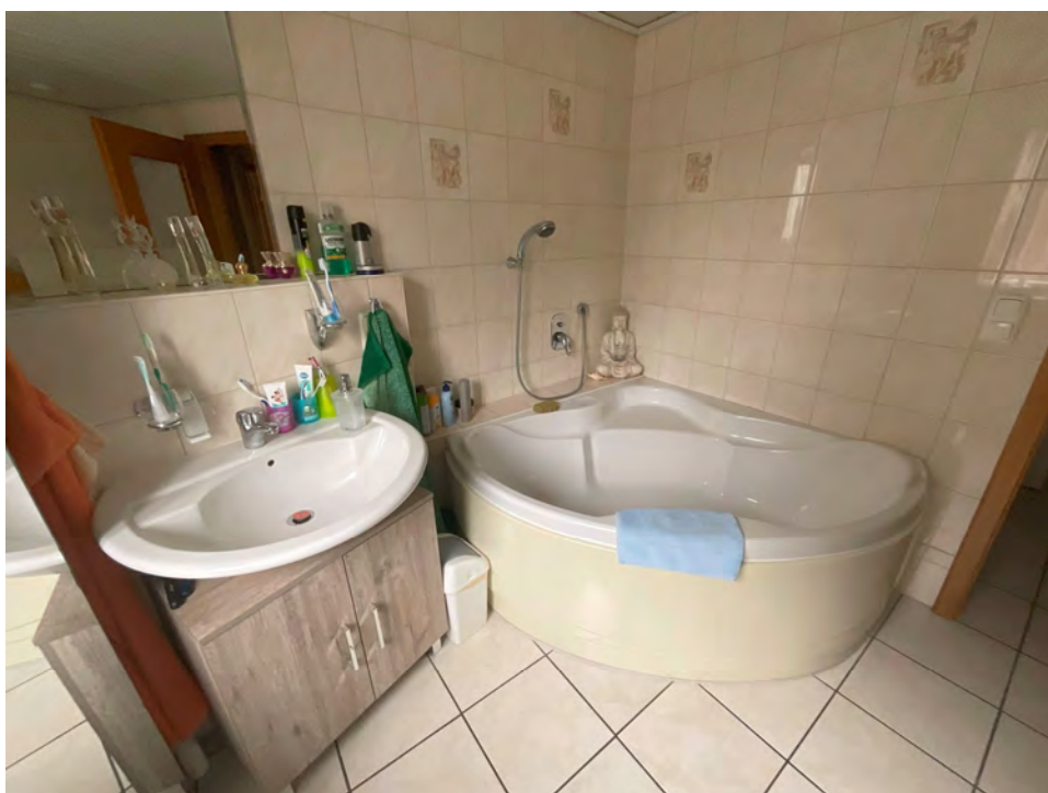
Lichtbild 6: Detail, sanitäre Einrichtungen Bad/WC mit separater Duschkabine in der Erdgeschosswohnung