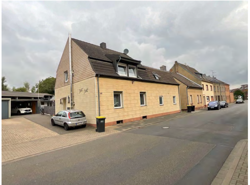
Lichtbild 1: Straßenbild der Kolpingstraße, mit Blick auf das Haus „Kolpingstraße 32“

Ortstermin am 24.07.2024 Kolpingstraße 32 in 50181 Bedburg (Blerichen)