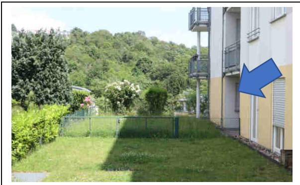
Blick auf die zu bewertende Wohnung