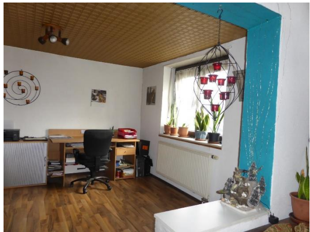
Bilder 7+8: Wohnhaus: EG: Wohnräume: Teilansichten