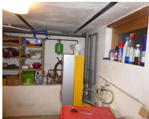
Bilder 4+5: Wohnhaus: Kellerräume: Teilansichten