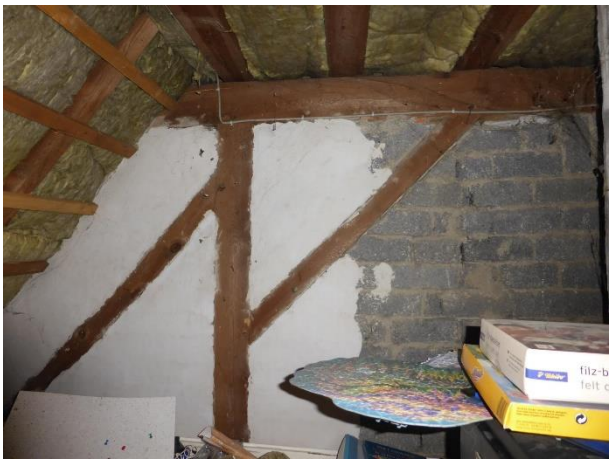
Bild 11: Wohnhaus: OG/DG: Teilansicht nicht fertig renovierter Speicherraum