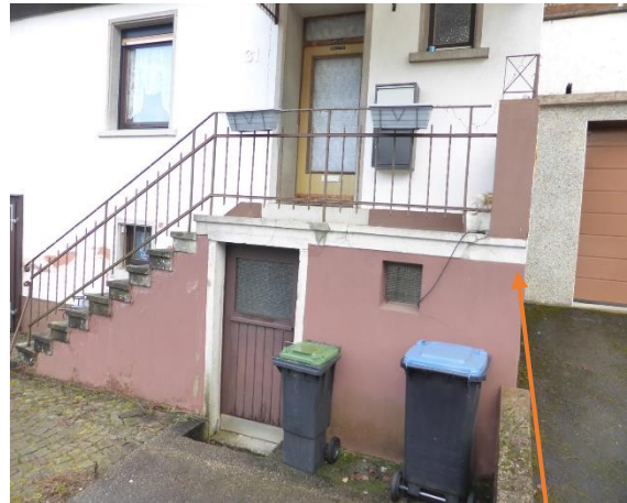
Bilder 1+2: Wohnhaus Ansichten zur Straße hin