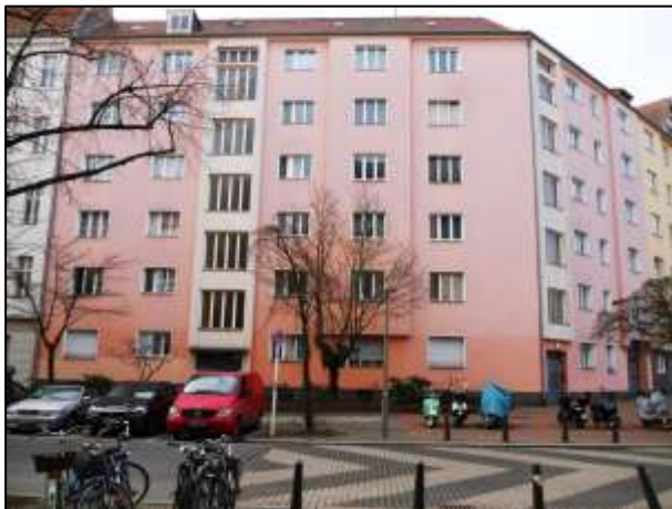
Straßenfront des Geb. Hildegardstraße 18A