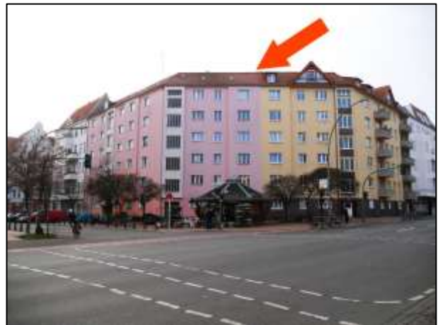
Grdst. Hildegardstraße 18, 18A