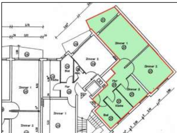
ETW-Nr. 30 im 5.OG im Geb. Hildegardstr.18