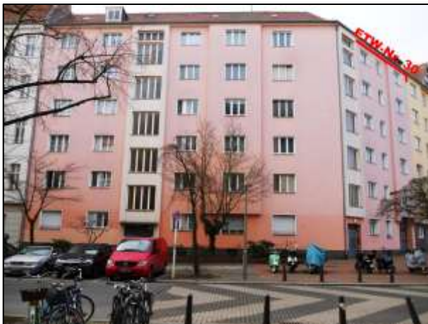
Gebäudefront Hildegardstraße 18A