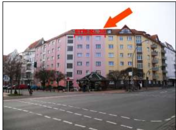
Hildegardstr. 18/18A (ETW-Nr. 30 im 5.OG)